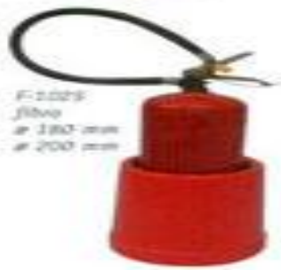
F-2029 fibra ø 180 mm ø 200 mm