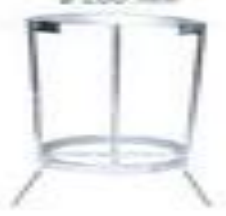
S-2073 ø 180 mm ø 200 mm