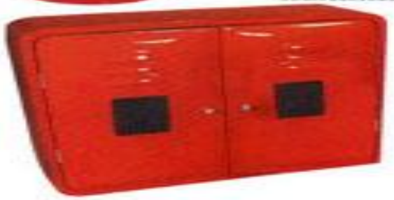
F-2057 fibra caixa para hidrante 230x900x1000 mm