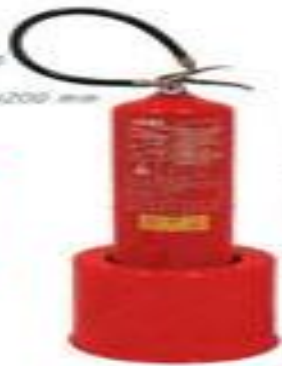
F-2029 fibra ø 180x200 mm