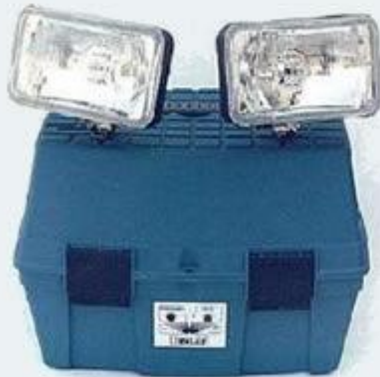
Luz de Emergência