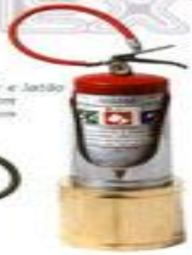
S-2067 aço inox e latão ø 180 mm ø 200 mm