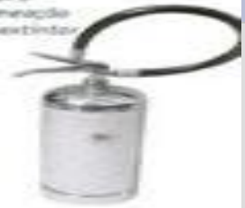
S-2079 Cromação em extintor