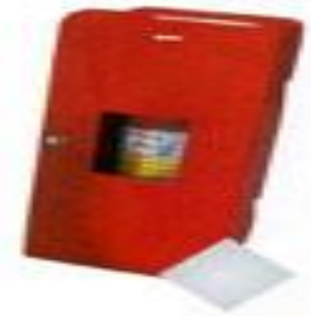
F-2058 fibra 250x350x830 mm