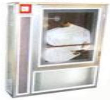
S-2090 caixa para hidrante perfil de alumínio vários modelos