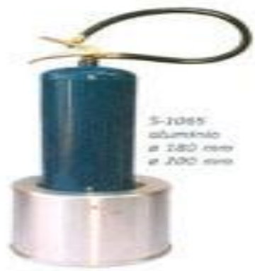
S-2085 alumínio ø 180 mm ø 200 mm