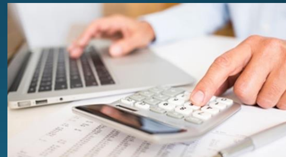
Prestação de Contas Digital