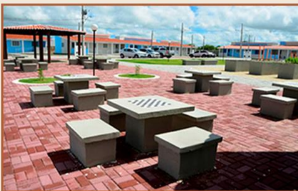
MESAS DE JOGOS