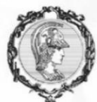
Escola Politécnica da Universidade de São Paulo