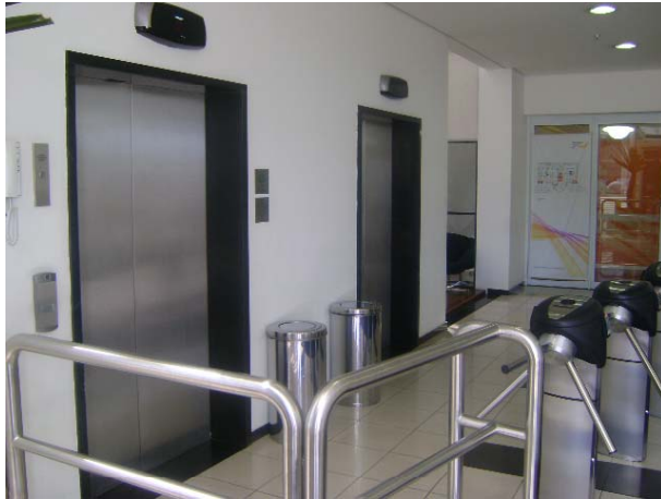
Elevador de passageiro