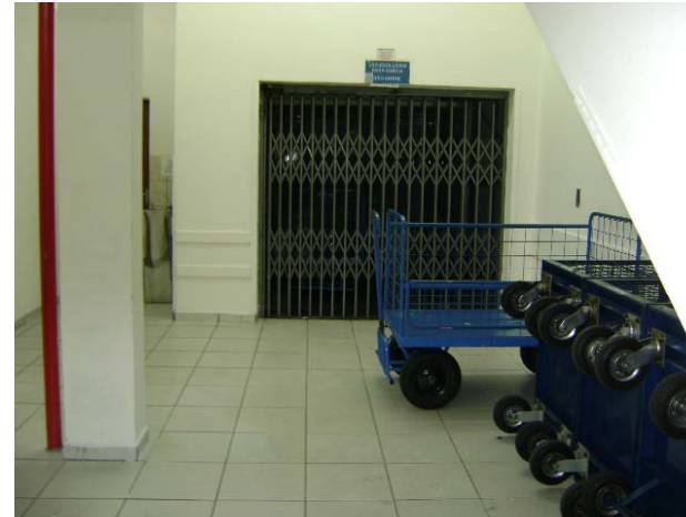
Elevador de carga