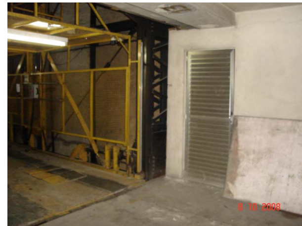
Elevador de carga para veículo