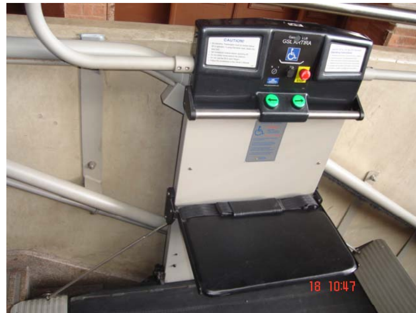
Plataforma para pessoas com mobilidade reduzida