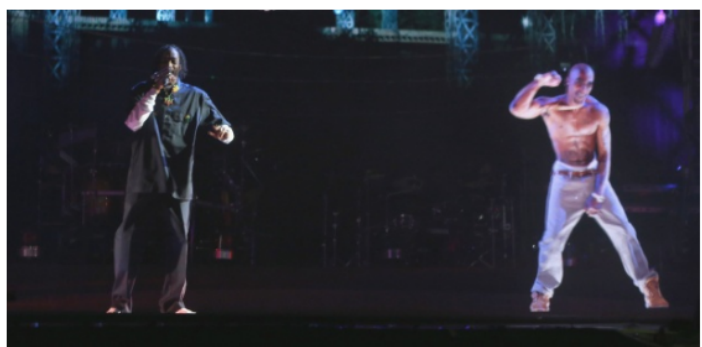
Apresentação de Snoop Dogg (à esquerda) com o holograma de Tupac Shakur no festival Coachella (15/4/12)

Do UOL, em São Paulo Tweet 224 Recomendar 184 Comentários 37