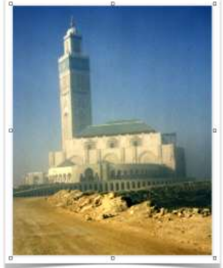
Mezquita Hassan II Casablanca