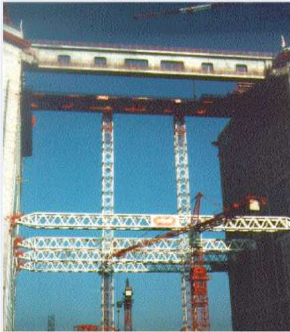
La Grande Arche La Défense