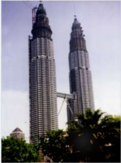
Torres Petronas Kuala Lumpur