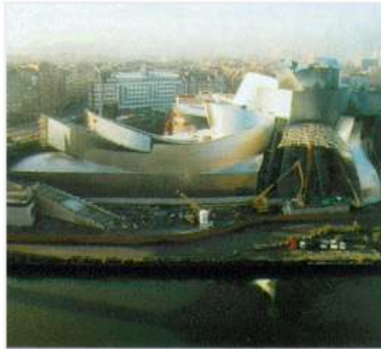
Museo Guggenheim Bilbao