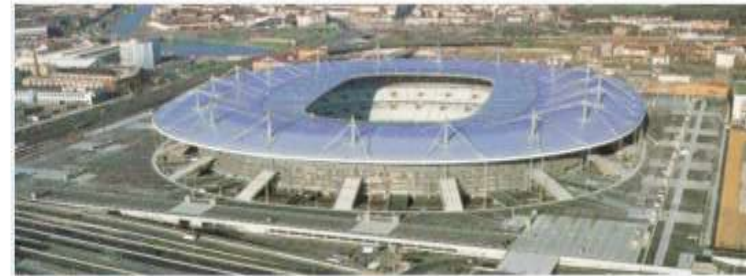
Estadio de Francia Saint-Denis