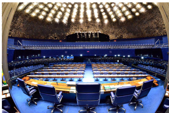
Plenário do Senado Federal

Em nota, o presidente do Senado, Davi Alcolumbre, avaliou que a proposta de isenção do Imposto de Renda (IR) "reforça o compromisso com o equilíbrio e o desenvolvimento econômico do país". Alcolumbre afirmou também que o Senado dará 'a devida atenção' à matéria.