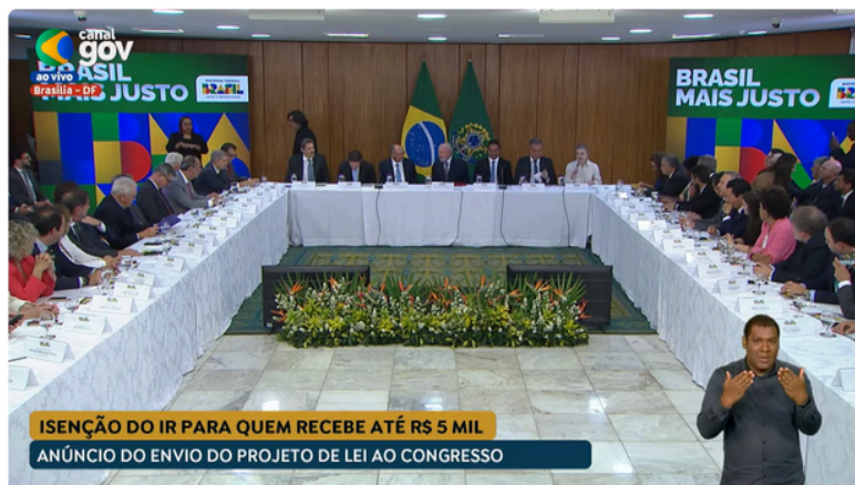
Cerimônia no Palácio do Planalto - 18/3/2025

Em cerimônia no Palácio do Planalto , o presidente da República, Luiz Inácio Lula da Silva, assinou em 18/3, terça-feira, o PL 1087/2025 , que prevê isenção de Imposto de Renda (IR) para pessoas que recebem até R$ 5 mil . Estavam presentes a ministra de Relações Institucionais, Gleisi Hoffmann; o ministro da Fazenda, Fernando Haddad, além do vice-líder do governo no Senado, Weverton (PDT/MA), representando o presidente Davi Alcolumbre (União/AP), o presidente da Câmara dos Deputados, Hugo Motta (Republicanos/PB), e demais líderes partidários do Congresso.