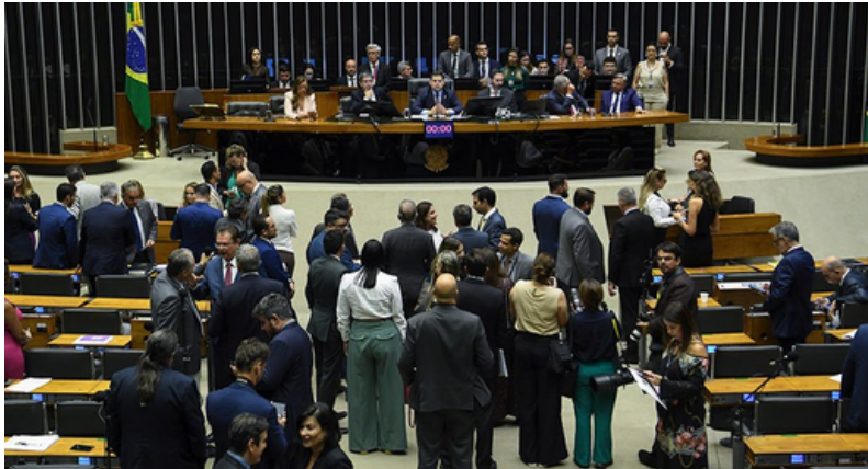
Sessão de votação do Congresso Nacional - 20/3/2025

O Congresso Nacional aprovou, na quinta-feira, 20/3, o Projeto de Lei Orçamentária Anual (LOA) de 2025 (PLN 26/2024) . A proposta, aprovada com um atraso de três meses, prevê um orçamento total de R$ 5,8 trilhões, com um limite de R$ 2,2 trilhões para despesas sujeitas ao arcabouço fiscal e um superávit estimado em R$ 15 bilhões.