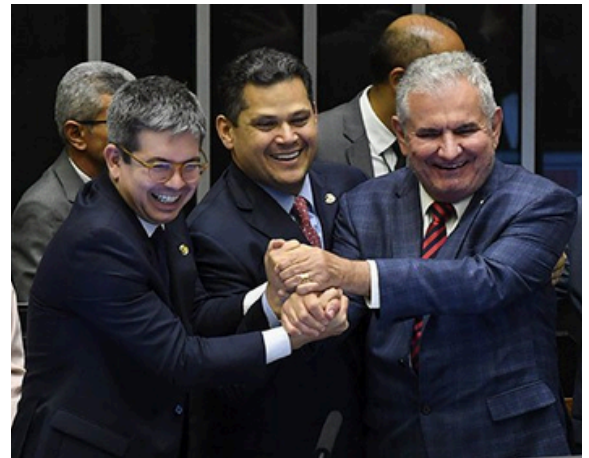
Randolfe Rodrigues (PT/AP), vice-líder do Senado; Davi Alcolumbre (UniãoAP), presidente do Senado; e Angelo Coronel (PSD/BA), relator do orçamento de 2025

Câmara Municipal define a presidência das Comissões - p. 6