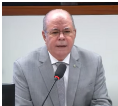
Rocha, durante audiência pública na CDU - 14/5/2025

Relator do PL 5663/2016 , que propõe a criação de um programa de locação social subsidiada pelo poder público , Rocha solicitou contribuições de representantes do governo e da iniciativa privada. De autoria do deputado Carlos Zarattini (PT/SP), o projeto prevê a utilização de até 50% dos recursos do Fundo de Arrendamento Residencial (FAR) para o financiamento do aluguel social de imóveis urbanos.