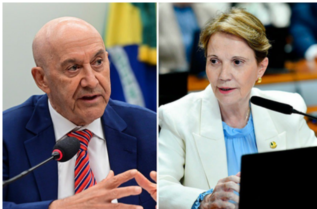
Relatores Moura (CMA) e Tereza Cristina (CMA)

A Comissão de Meio Ambiente (CMA) do Senado Federal retomou, na terça-feira, 13/5, os trabalhos sobre o PL 2159/2021 , que institui a Lei Geral do Licenciamento Ambiental . A proposta tem como objetivo principal a simplificação e a celeridade nos processos de licenciamento, especialmente para empreendimentos classificados como de menor impacto ambiental. Sob a relatoria do senador Confúcio Moura (MDB/RO) , a discussão do parecer foi adiada para a próxima reunião da comissão, em função da concessão de vista coletiva aos demais membros.