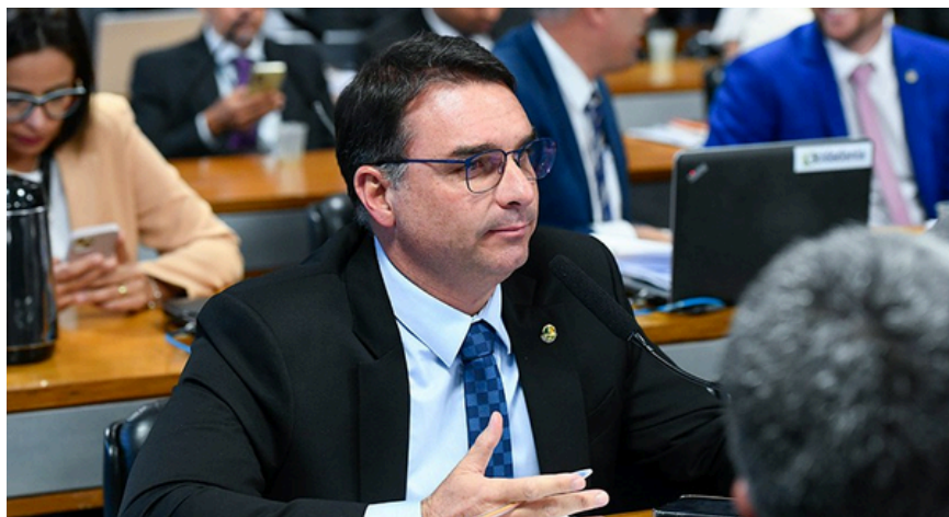
Flávio Bolsonaro, relator da matéria

Paralelamente, o Senado também analisa na Comissão de Constituição e Justiça (CCJ) a PEC 3/2022 , conhecida como PEC das Praias , de autoria do ex-deputado Arnaldo Jordy (Cidadania/PA), que prevê a transferência da propriedade dos terrenos de marinha a particulares , mediante pagamento, enquanto estados e municípios os receberiam de forma gratuita. A matéria, que possui parecer favorável à proposta e com três emendas do senador Flávio Bolsonaro (PL/RJ) , segue pendente de votação pelo colegiado.