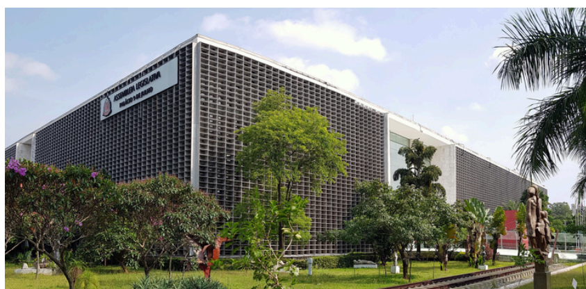
Palácio 9 de Julho - sede do legislativo paulista

Por meio do Ato do Presidente nº 59/2025 , publicado na quinta-feira, 15/5, na seção Atos Legislativos e Parlamentares do Diário Oficial do Estado, a Assembleia Legislativa de São Paulo (Alesp) oficializou a nova composição das comissões permanentes para o segundo biênio da 20ª Legislatura. A definição dos nomes dos parlamentares que integrarão os 21 colegiados da Casa segue as indicações partidárias, conforme estabelecido pelo Regimento Interno, e terá validade pelos próximos dois anos.