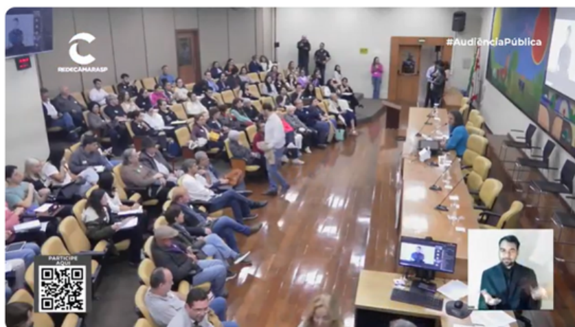
Audiência Pública da CPU - 13/5/2025

A Comissão de Política Urbana, Metropolitana e Meio Ambiente (CPU) da Câmara Municipal de São Paulo realizou, na terça-feira, 13/5, audiência pública para discutir o processo de tombamento do Quadrilátero Vilas do Sol , conjunto urbano localizado em Pinheiros, Zona Oeste da capital, composto por 42 casas e cerca de 90 comércios.