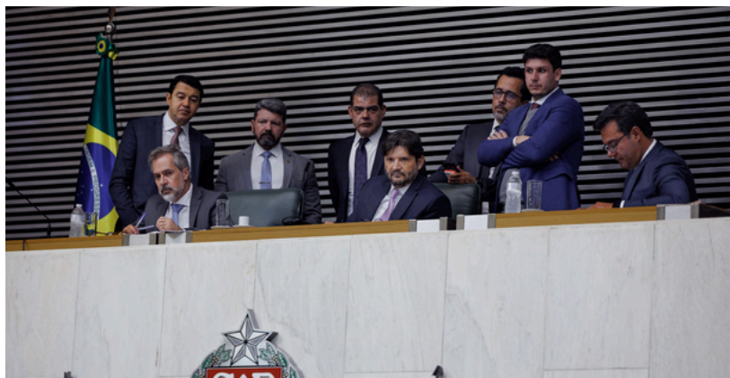
Sessão Extraordinária de votação - 13/5/2025

A Assembleia Legislativa do Estado de São Paulo (Alesp) aprovou na terça-feira, 13/5, o PL 411/2025 , de autoria do Executivo, que reajusta o novo valor do salário-mínimo Paulista para R$ 1.804 . A proposta representa um aumento de 10% sobre o valor anterior, de R$ 1.640, sendo aproximadamente 5% de ganho real acima da inflação.