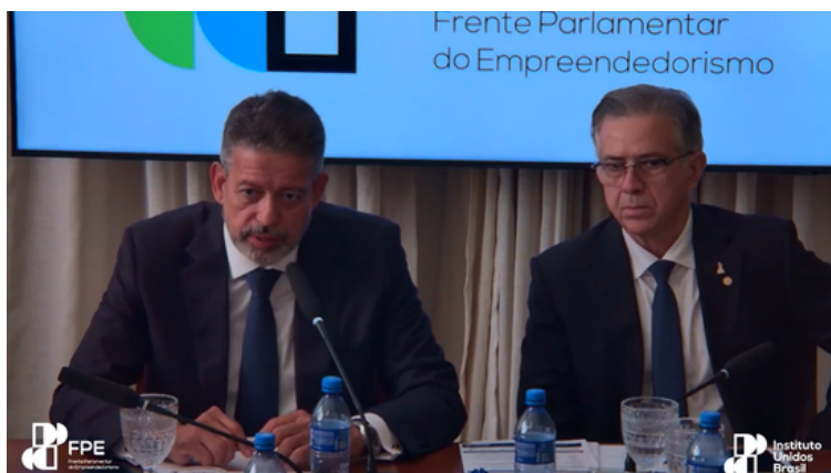
Lira e Passarinho, durante o encontro da FPE

O Secovi-SP participou, na terça-feira, 12/8, de um encontro promovido pela coalizão das Frentes Produtivas do Congresso Nacional com o ex-presidente da Câmara dos Deputados, Arthur Lira (PP/AL) . A pauta foi a reforma do Imposto de Renda , e o evento contou com a presença de parlamentares, lideranças empresariais e representantes de entidades de classe.