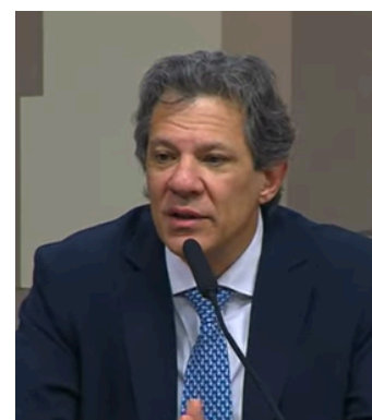
Haddad, ministro da Fazenda

Com prazo até 8/10 para votação final, a matéria segue sob a relatoria deputado Carlos Zarattini (PT/SP) , na Comissão Mista do Congresso Nacional, presidida pelo senador Renan Calheiros (MDB/AL) .