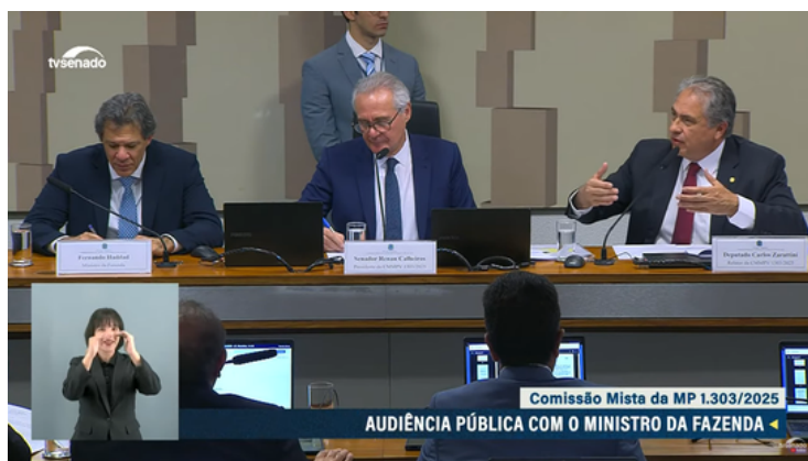
Audiência pública da Comissão Mista da MP 1303/2025

O Ministério da Fazenda apresentou em audiência pública na comissão mista do Congresso Nacional na terça-feira, 12/8, a análise da Medida Provisória (MP) n° 1303/2025 , que propõe mudanças voltadas ao setor financeiro, com destaque para a nova tributação sobre determinados fundos de investimento e títulos incentivados . A iniciativa, segundo o governo, busca padronizar regras, ampliar a transparência e garantir maior eficiência na destinação dos recursos captados.