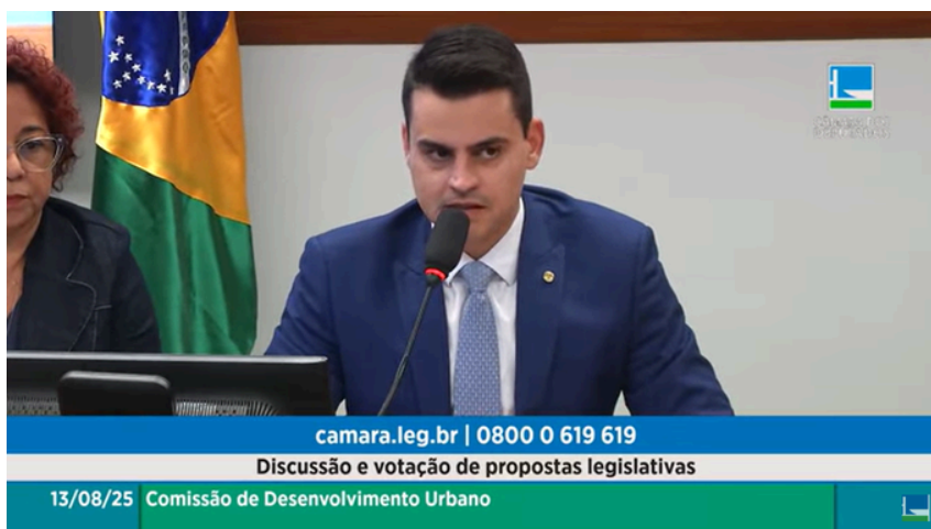
Yuri do Paredão (MDB/CE), presidente da CDU

A Comissão de Desenvolvimento Urbano (CDU) da Câmara dos Deputados aprovou, quarta-feira, 13/8, uma série de projetos de lei relacionados à habitação, à gestão condominial e à infraestrutura urbana . As proposições tratam de alterações em normas existentes e da criação de novos programas, abrangendo temas como critérios para construção de unidades habitacionais, uso racional de recursos, capacitação em acessibilidade, destinação de moradias para grupos específicos e medidas de segurança em áreas comuns de edificações.