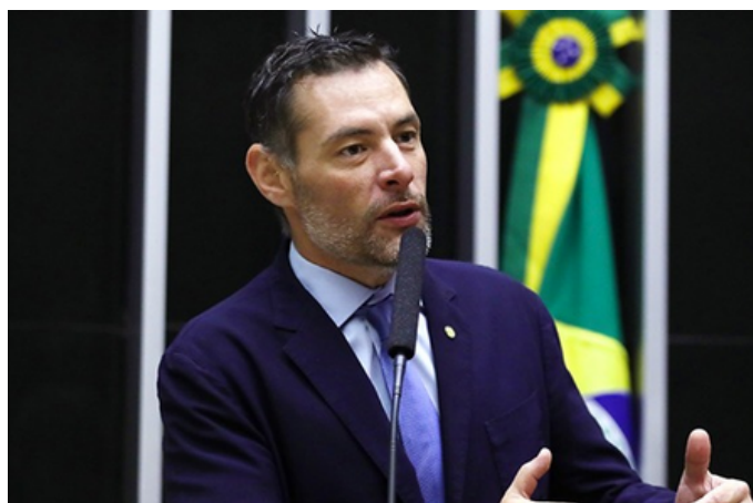
Marangoni, autor da emenda

Ficam preservados de aumentos da carga tributária alguns regimes considerados estratégicos, como o Programa Minha Casa Minha Vida, o Simples Nacional e a desoneração da folha de pagamento (INSS), cabendo ao Poder Executivo a sua regulamentação.